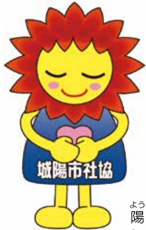
ようた 陽太くん