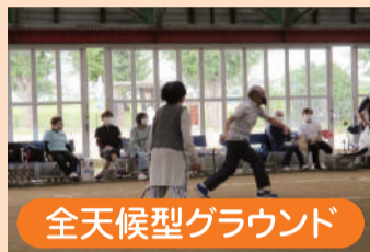
全天候型グラウンド