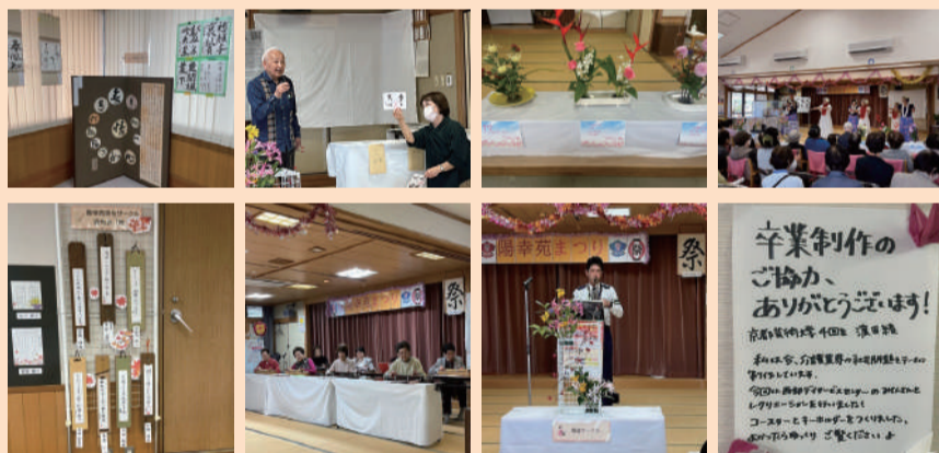
各サークルの集大成、日頃の練習の成果をご覧あれ