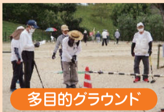
多目的グラウンド