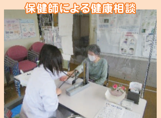
保健師による健康相談