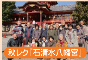
秋レク「石清水八幡宮」