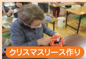
クリスマスリース作り