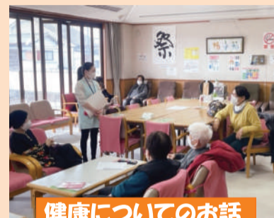
健康についてのお話