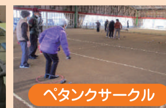
ペタンクサークル