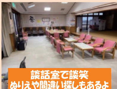
談話室で談笑 めいえや間違い探しもあるよ