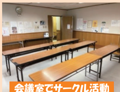
会議室でサークル活動