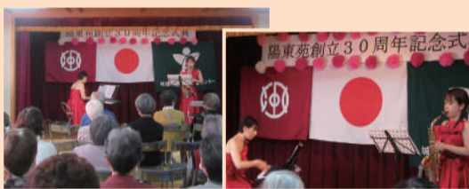
「ティーム」 電子ピアノ&サクソ演奏