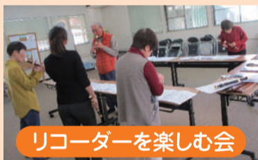
リコーダーを楽しむ会