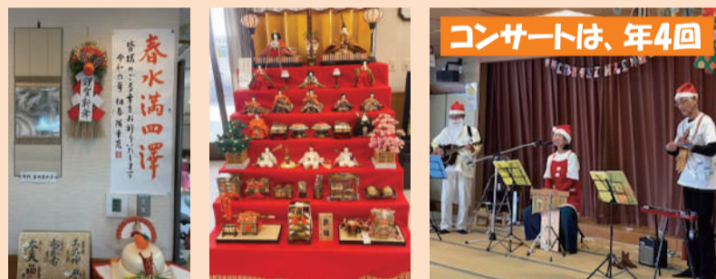
コンサートは、年4回