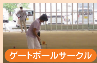
ゲートボールサークル