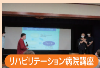
リハビリテーション病院講座