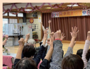
口腔体操は大人気