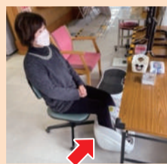
フットマッサージャー