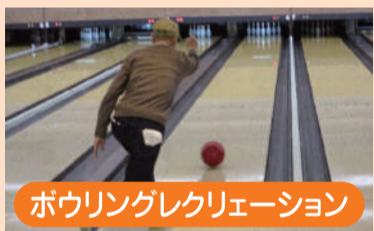
ボウリングレクリエーション