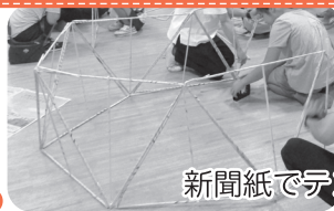
新聞紙でテントをつくりました！