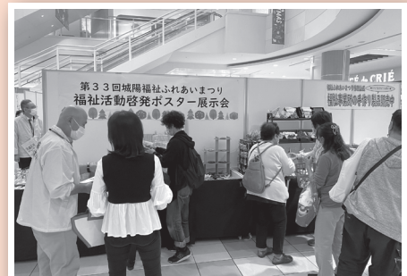
会場(アル・プラザ城陽)の様子 (昨年度)