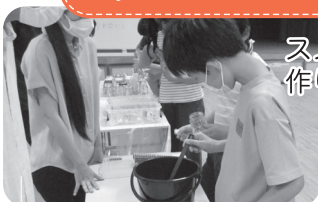
スノードーム作り